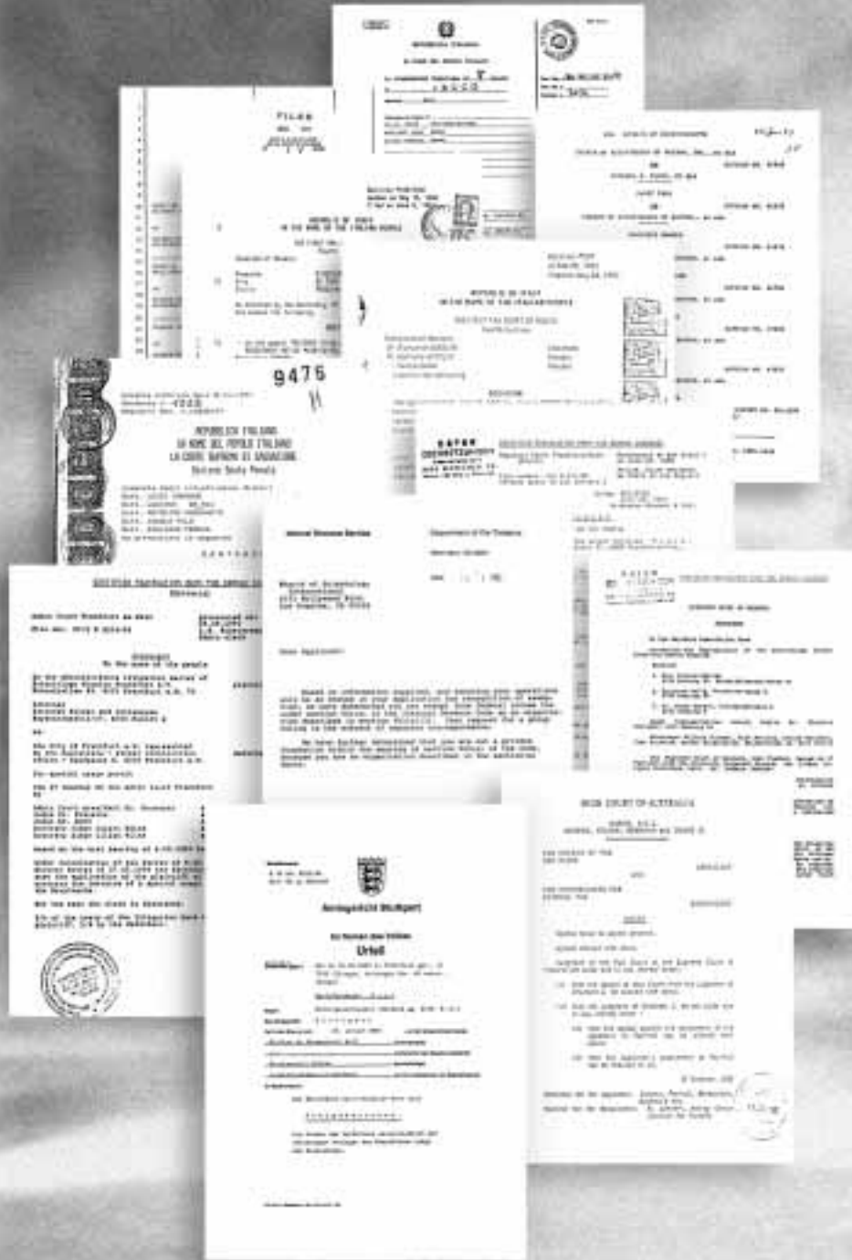
Dies sind nur einige der Gerichtsurteile, die den Religionscharakter von Scientology bestätigen. Sie kommen aus Ländern der ganzen Welt – von Albanien bis Taiwan und von Costa Rica bis Rußland.