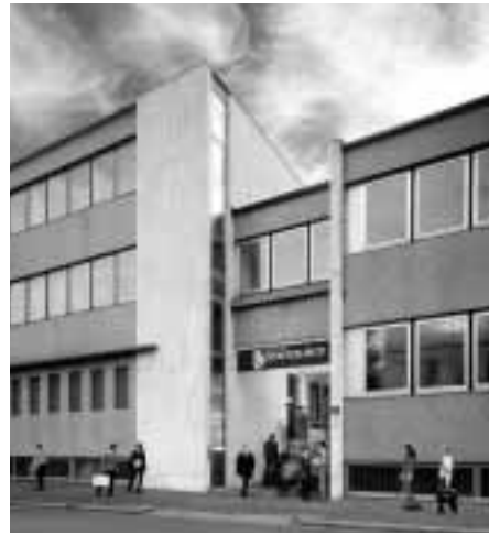
Die Scientology-Kirche in Mailand