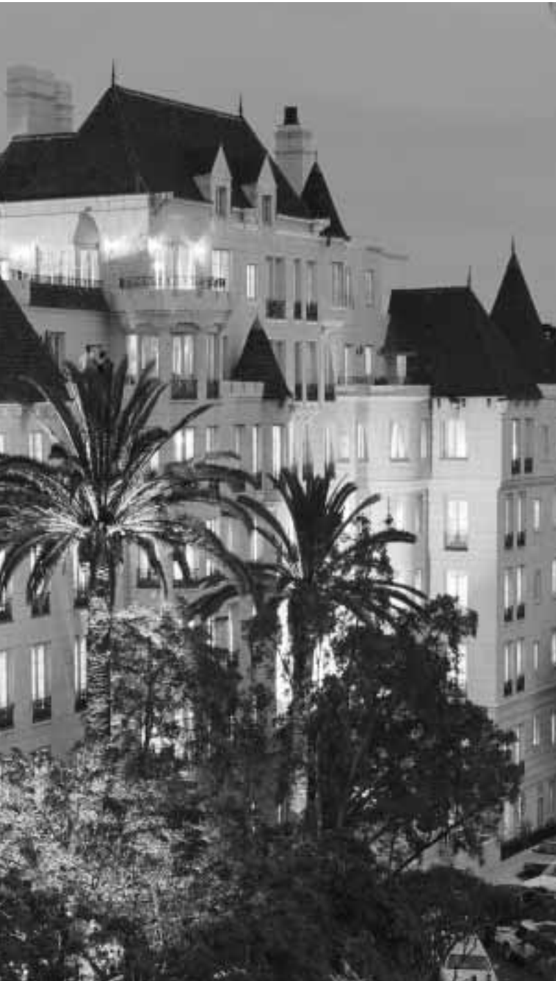
Mitten in Hollywood stellt die Church of Scientology Celebrity Center International eine Oase für Künstler dar, die spirituelle Freiheit durch die Ausübung von Dianetik und Scientology zu erlangen suchen.