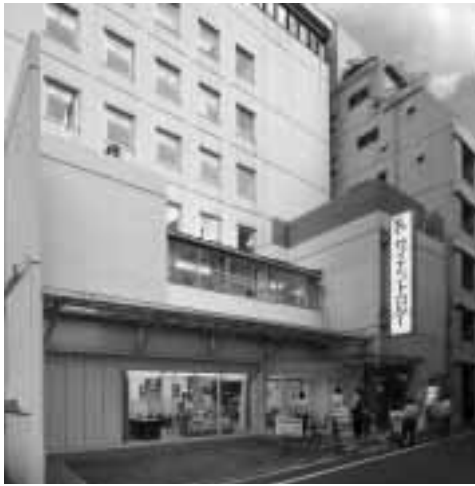
Die Scientology-Kirche in Tokio