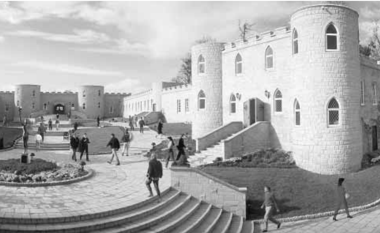
Sogenannte Advanced Organizations (Höhere Organisationen) und Saint-Hill-Kirchen kümmern sich um Gemeindeglieder in der ganzen Welt. Entgegen dem Uhrzeigersinn: Die Advanced Organization/Saint-Hill-Kirche in East Grinstead, England; die Advanced Organization in Los Angeles, Kalifornien; die American Saint Hill Organization in Los Angeles und die Advanced Organization/Saint-Hill-Kirche in Kopenhagen, Dänemark.