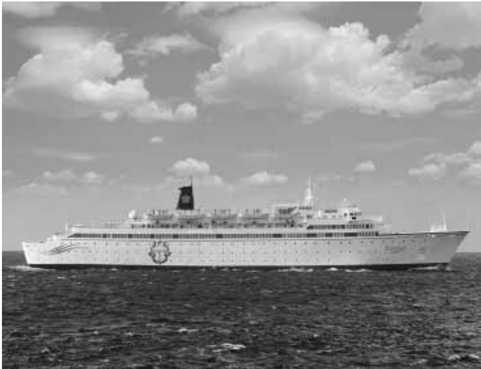
Scientology-Auditing der höchsten Stufen findet an Bord des 135 Meter langen Motorschiffs Freewinds statt, dem Sitz der Church of Scientology Flag Ship Service Organization.

höchsten Stufe sowie besondere Ausbildungsschritte gehören, die nirgendwo sonst durchgeführt werden können. Diese Kirche ist auch deshalb einzigartig, weil sie ihre Dienste auf der MS Freewinds abhält, einem etwa 135 Meter langen Schiff, das in der Karibik kreuzt. Die Freewinds ist der ideale Ort zur religiösen Besinnung. Dort können Scientologen ihre ganze Aufmerksamkeit ihrem spirituellen Fortschritt widmen – in einer Umgebung, die den Lehren der Scientology gerecht wird.