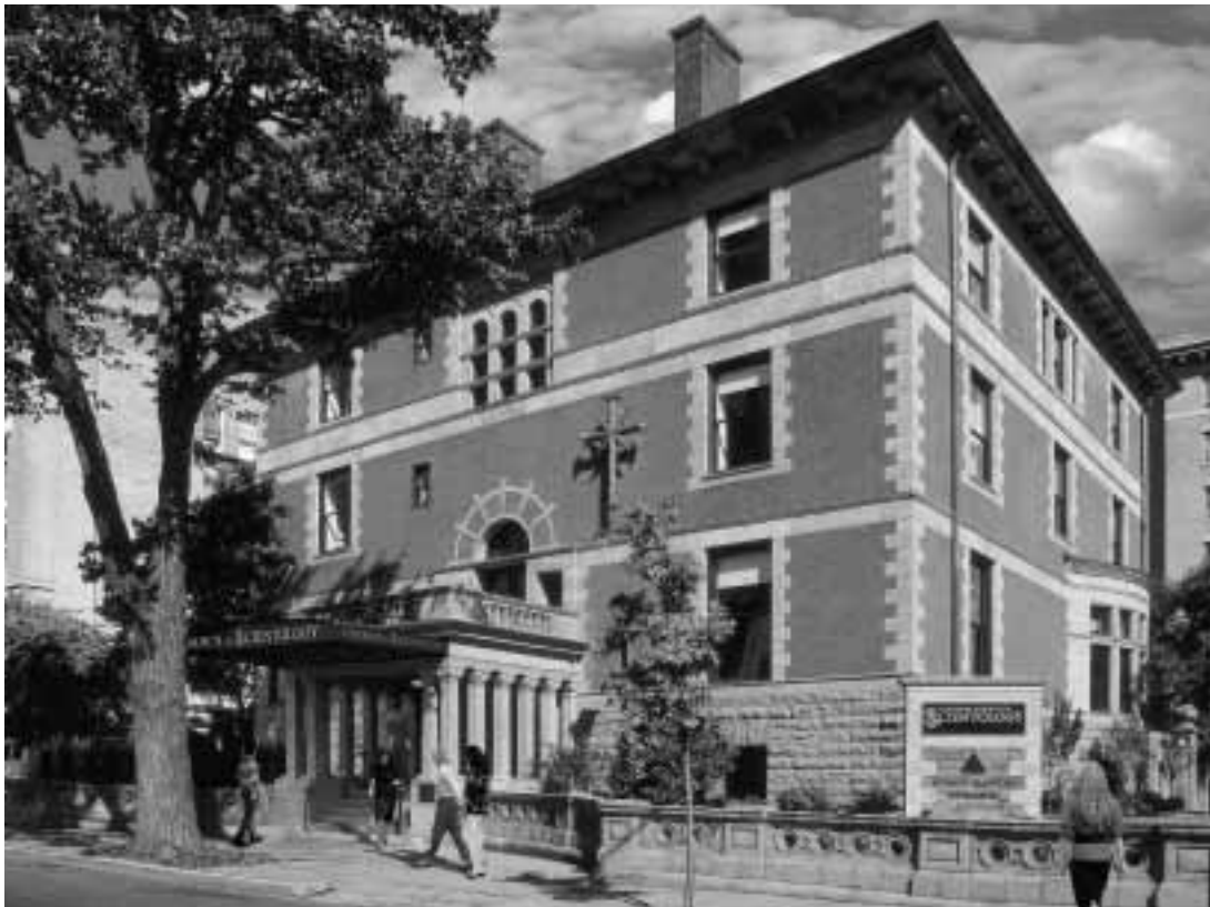
Die Gründungskirche in Washington, D.C.: Hier finden Geschäftsleute und Politiker der US-Hauptstadt ein spirituelles Zentrum.